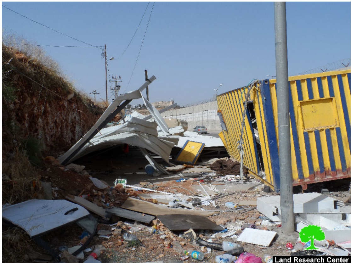
مشاهد من البركسات التجارية المدمرة - بلدة الرام