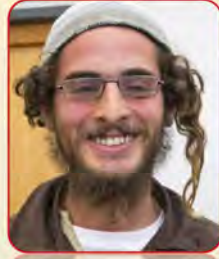
المجرم قاتل عائلة دوابشة

أصدرت المحكمة العليا الإسرائيلية في جلستها الأخيرة للبت في قضية عائلة دوابشة قراراً يبرئ ساحة المتهم من التهمة بدعوى الجنون وعدم كفاية وثبوت الأدلة المقدمة...؟!